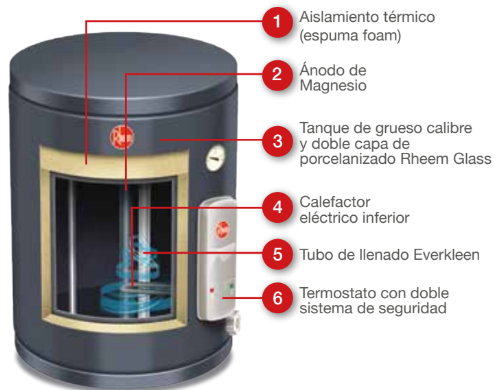
Ilustración genérica, solo para referencia.