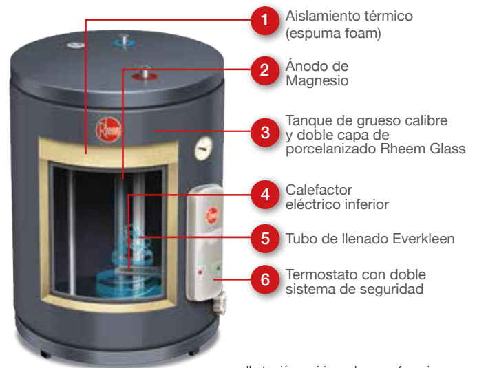
Ilustración genérica, solo para referencia.