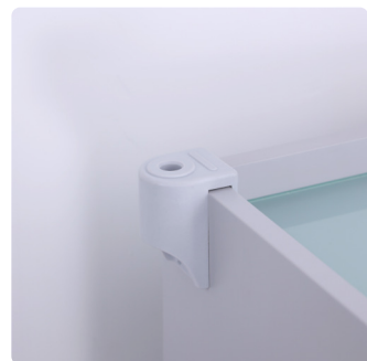
Support pour lampe